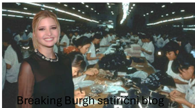
Breaking Burgh satirični blog