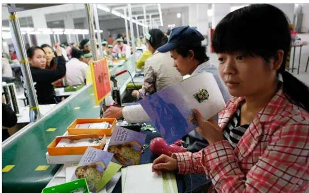
Adorable! Ivanka Trump Reunited With Long-Lost Sweatshop While On Asia Trip