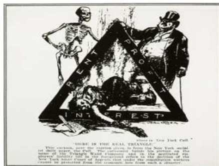
Triangle Shirtwaist Co. Požar 1911 - NYC